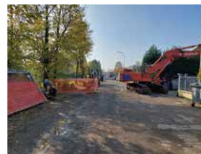
A sinistra lo stato della strada prima dell'avvio del cantiere, a destra i primi giorni di lavori su via Grandi