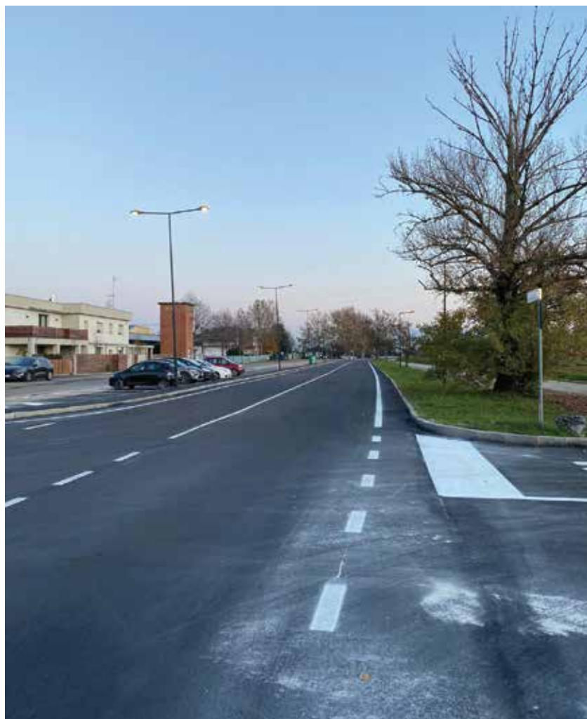
Via Passerotta dopo i lavori

lunghezza di via Passerotta: in questo modo si è sostituito tutto l'inerte con un misto ghiaia-cemento a cui è stato sovrapposto binder e il tappeto di usura finale. Sono anche stati sistemati i parcheggi laterali e i tratti di marciapiedi. I lavori hanno riguardato anche la rotonda "Prime Donne Elette", alla congiunzione con via Mulino, in cui sono stati riempiti gli avvallamenti e rifatta l'asfaltatura superficiale sia nella