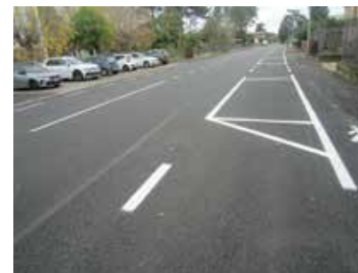
A sinistra lo stato della strada nel 2019, a destra, a inizio novembre 2021, al termine dei lavori

Da oltre due mesi via Badini, nella zona industriale di Quarto Inferiore, è stata rimessa a nuovo grazie a un profondo intervento di rifacimento del manto stradale. Dopo diversi anni dall'ultima manutenzione erano presenti buche sempre più larghe e profonde sulla sede stradale, in alcuni punti pressoché distrutta (come si può vedere nelle immagini prima dell'intervento). A metà luglio sono partiti i lavori del tratto di circa 600 metri che va dall'incrocio con via Zenetta a quello con via Viadagola. Sono state completamente rifatte le due corsie centrali e sono state riqualificate anche le fasce laterali alle corsie, piuttosto disordinate e ammalorate, su cui da progetto non era previsto inizialmente alcun intervento. I lavori si sono conclusi in meno di due