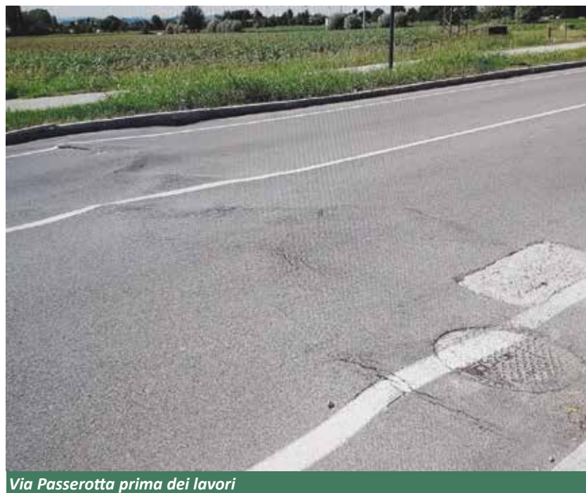
Via Passerotta prima dei lavori

to non inerte ma permeabile all'acqua. Questo ha causato i rigonfiamenti e un rapido ammaloramento. Nel corso degli anni, essendo ancora in garanzia i lavori svolti, la ditta esecutrice è stata chiamata ad intervenire per risolvere il problema: dapprima con piccoli e localizzati interventi di sostituzione dell'asfalto nei punti più danneggiati, poi anche con un intervento più consistente sull'intero asse, che però non si è rivelato sufficiente perché non è andato così in profondità da eliminare tutto il materiale all'origine del problema. Si è quindi deciso, con questi ultimi lavori, di procedere in maniera più drastica effettuando uno scavo profondo 60 centimetri in tutti i circa 300 metri di