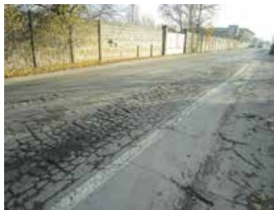
A sinistra lo stato della strada prima dell'avvio del cantiere, a destra i risultati dei lavori su via Matteotti